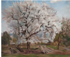
カール＝フレードリック・ヒル《花咲くリンゴの木》 1877年 油彩、カンヴァス スウェーデン国立美術館蔵

1月27日から4月12日まで、東京都美術館で「スウェーデン絵画 北欧の光、日常のかがやき」が開催されます。スウェーデンの若い芸術家たちは、19世紀末からフランスで学び人間や自然をありのままに表現するレアリズムに傾倒しました。彼らは故郷へ帰るとスウェーデンらしい芸術の創造をめざし、自然や人々、あるいは日常にひそむ輝きを、親密で情緒あふれる表現で描き出しました。本展はスウェーデン国立美術館の全面協力のもと、19世紀末から20世紀にかけて生み出された絵画をご紹介します。