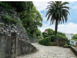
かつて外国人を「オランダさん」と呼んだことに由来し、彼らが通った坂道が「オランダ坂」と呼ばれるようになった。