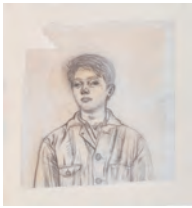
松本竣介 《立てる像下絵》 1942年 神奈川県立近代美術館蔵

1月15日から3月22日まで、パナソニック汐留美術館で「美しいユートピア 理想の地を夢みた近代日本の群像展」が開催されます。ウィリアム・モリスの『ユートピア便り』は日本でも受け入れられ、「ユートピア」の理想と課題から美術、工芸、建築など幅広いジャンルを結ぶ共同体が模索されました。本展では、鶴岡政男や松本竣介の絵画、建築家・立原道造のスケッチ、今和次郎の民家採集図、磯崎新による群馬県立近代美術館のシルクスクリーンなど、「ユートピア」のテーマのもと作品資料約170点をご覧ください。