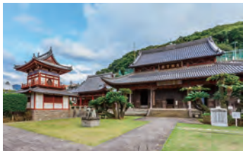
1620年創建の「興福寺」。中国・南京出身者が建てたことから「南京寺」とも呼ばれる。

寺院が建ち並ぶ寺町エリアでは、日本最初の唐寺とされる「興福寺」や、九州一の梵鐘で知られる「聖福寺」が重要な場面に登場します。さらに、外国人居留地の面影が残る「オランダ坂(活水坂)」、世界遺産「大浦天主堂」、長崎新地中華街など、観光客に人気のスポットでも撮影が行われ、長崎らしい風景が随所に