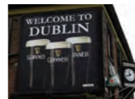
世界的に有名なアイリッシュビール「ギネス」の生誕地でもあるダブリン。

東京(成田空港)からロンドン(ヒースロー空港)まで約12時間30分。ロンドンからダブリン(ダブリン空港)まで約1時間30分。市内中心部へは車で約30分。