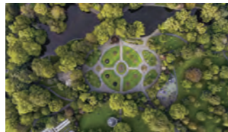
9ヘクタールを誇る公園「セント・ステイプンス・グリーン」。文豪ジョイスや詩人イェーツの記念像などもある。

映画の撮影はダブリン市内各所で行われました。主人公が弾き語りをするシーンは、ストリートミュージシャンたちが実際に演奏している繁華街「グラフトン・ストリート」で撮影されています。また、近隣にあるジョージ王朝時代の公園「セント・ステイプンス・グリーン」は、泥棒を捕まえるシーンのロケ地として使われました。市民の憩いの場として親しまれる公園の美しい景観は、映画に彩りを添えています。