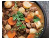
羊肉、じゃがいも、玉ねぎなどを煮込んだ「アイリッシュシチュー」は伝統的な家庭料理。

ダブリンを訪れたら、ぜひパブにも足を運びましょう。数多くのパブが集まる「テンプル・バー」周辺で人気の「ザ・ブレイズン・ヘッド」は、1198年創業のダブリン最古のパブとして知られています。ここでは、羊肉を使った伝統的な「アイリッシュシチュー」が評判で、ダブリン生まれのギネスビールとの相性も抜群です。