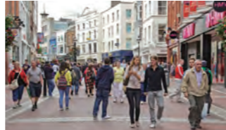
高級ショッピングやカフェなどが建ち並び目抜き通り「グラフトン・ストリート」。

近年、ダブリンを舞台にした映画が話題を集めています。その代表作が、ダブリン生まれのジョン・カーニー監督による『ONCE ダブリンの街角で』(2007年・アイルランド/アメリカ)。この作品は、売れないストリートミュージシャンと、生きる希望を探す移民の女性が出会い、音楽を通して心を通わせていく姿を描いています。口コミで評判が広がり、アメリカで観客動員を増やし、主題歌は第80回アカデミー賞で主題歌賞を受賞しました。