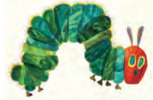
エリック・カール 『はらぺこあおむし』1987年版 表紙 1987年 エリック・カール絵本美術館

4月25日から7月26日まで、東京都現代美術館で「エリック・カール展 はじまりは、はらぺこあおむし」が開催されます。エリック・カールはアメリカを代表する絵本作家。絵本『はらぺこあおむし』は現在も世界中の子供たちに愛されています。本展は『はらぺこあおむし』日本語版50周年を記念して、米国のエリック・カール絵本美術館と共に開催。絵本の原画の他にデザイナー時代の作品や構想段階のダミーブック、コラージュの素材など約180点を展示し、表現力豊かな絵本作家の魅力に迫ります。