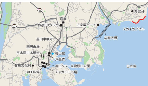
「スカイカプセル」は海雲台の海の間近を走る。

東京(羽田空港)から釜山(金海国際空港)まで約2時間半。空港から市内中心部まで車で約30分。