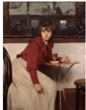
ラモン・カザス《マドレーヌ》 1892年 油彩、カンヴァス ムンサラット美術館

6月13日から9月23日まで、丸の内の三菱一号館美術館で「“カフェ”に集う芸術家—印象派からゴッホ、ロートレック、ピカソまで」が開催されます。19世紀後半のパリでは芸術家がカフェに集い、そこで出会いや議論を通じて新しい芸術を生み出しました。本展では、“カフェ”をキャバレーなども含む広い意味で捉え、印象派からゴッホ、ロートレック、ナビ派、ピカソまで、芸術家が“カフェ”という場所でどのように触発され作品を生み出したかを紹介します。