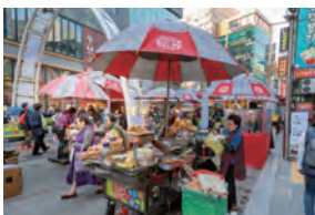
繁華街・南浦洞にある「BIFF広場」。広場というより繁華街の一角で、ホットク屋台が立ち並ぶ。

また、韓国最大の水産市場「チャガルチ市場」や「龍頭山公園」などの観光スポットもロケ地の一つ。龍頭山公園内にある「釜山タワー」は人気のビュースポットで、特に夜景は地元の人々にも大人気です。