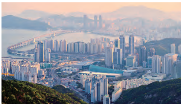
釜山広域都市の人口は約330万人(2023年)。韓国最大の港湾都市として、海運や貿易、製造業が経済の基盤を支えており、近年は観光業やIT産業にも注力している。新鮮な海鮮料理や活気ある独自の市場文化、特有の方言も魅力。

現在は近代的な港湾・ビジネス都市として発展していますが、「海雲台」や「広安里」などさまざまなビーチリゾートの他、レトロな雰囲気が残る「甘川文化村」などの観光スポットも点在。人気観光地として国内外から注目されています。またアジア最大級の「釜山国際映画祭」など国際的なイベントも多く開催されており、リゾート・食・文化と多彩な魅力を持つ釜山には、日本からも多くの観光客が訪れています。