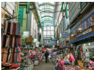
「国際市場」は人気観光スポットで、衣料品、雑貨、屋台グルメなど何でも揃う。