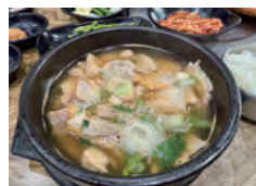
放出品の豚の骨や肉を煮込んだのが「テジクッパ」のルーツといわれている。

ロケ地巡りの食事で外せないのは、豚肉の各部位を煮込んだスープにご飯を入れた定番の郷土料理「テジクッパ」。西面テジクッパ通りには専門店が集まっているほどで、中でも1946年創業の「松亭3代クッパ」は移り変わりの激しい釜山で長年愛されてきた名店です。韓国の民俗酒第1号に指定された名酒「金井山城マッコリ」を合わせれば、釜山を代表するソウルフードが堪能できます。