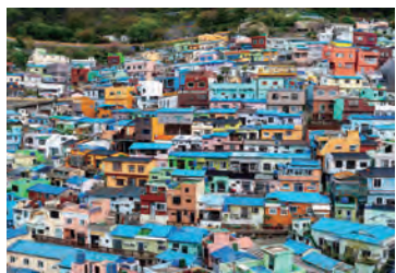
斜面につくられた集落をアート力で再生した「甘川文化村」。