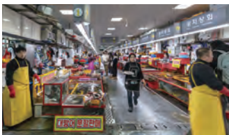
水産市場「チャガルチ市場」は新鮮な魚介類を韓国式の味付けで楽しめる。